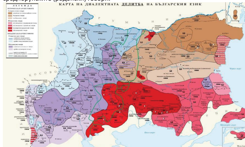
Фиг. 1. Карта на диалектната подялба на българския език

В етнографската литература често се споменава, че изследваната област има свой особен диалект наречен чечки (чечки говор). Съгласно картата на диалектната делитба на българския език, съставена през 2014 година от Секцията по диалектология и лингвистична география на Института за български език към Българската академия на науките на територията на българското езиково землище чечкия говор спада към среднорупските (родопски) говори.